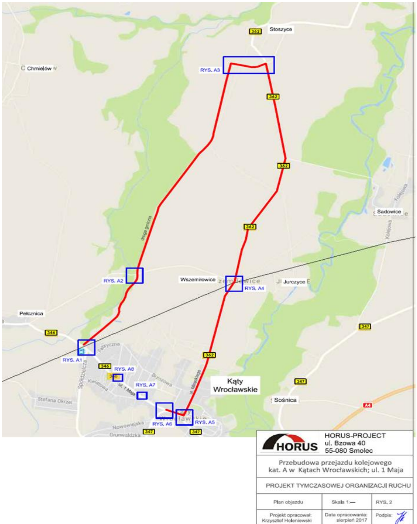
Rys. 1 OBJAZD A - dla pojazdów o masie poniżej 12 ton